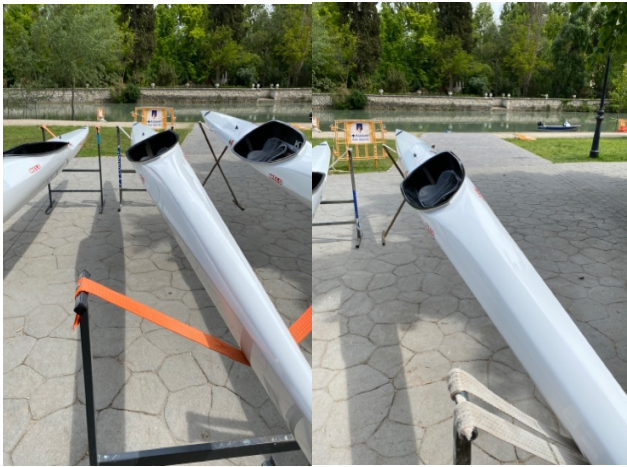
K1_FMP – CETD 09