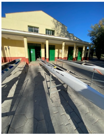
C1_FMP – CETD 04