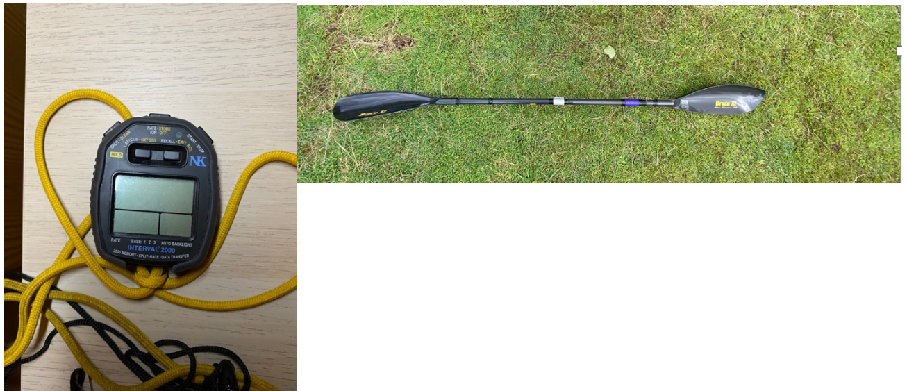
FOTOGRAFÍA 11. CRONÓMETRO Y PALA