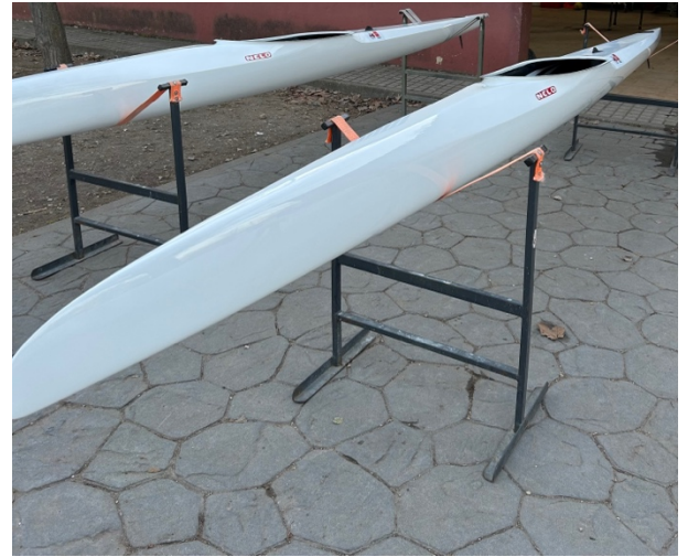
K1_FMP – CETD 11