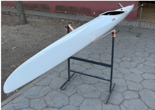
K1_FMP – CETD 12