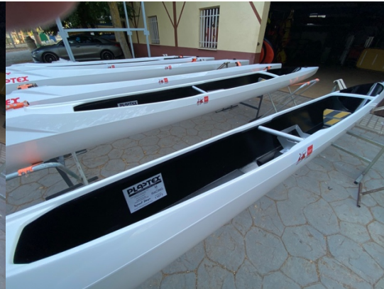
C1_FMP – CETD 11