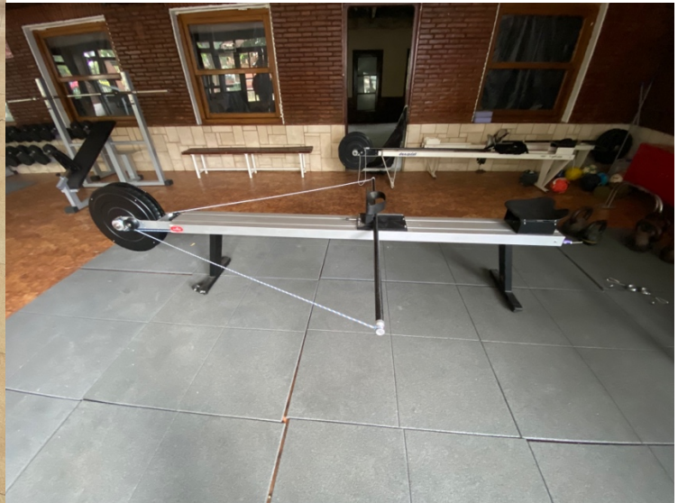
FOTOGRAFÍA 9. ERGOMETROS