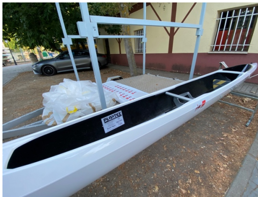
C1_FMP – CETD 06