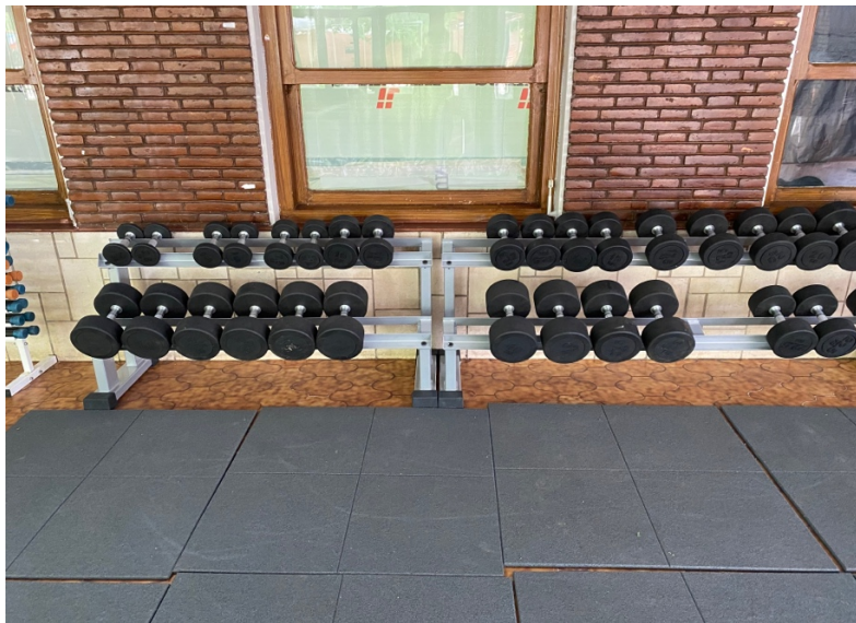
FOTOGRAFÍA 1. MANCUERNAS Y SOPORTES DE HIERRO