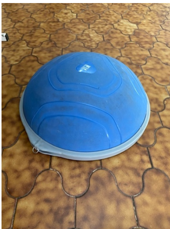
FOTOGRAFÍA 5. BOSU