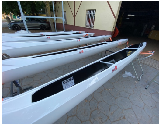
C1_FMP – CETD 09