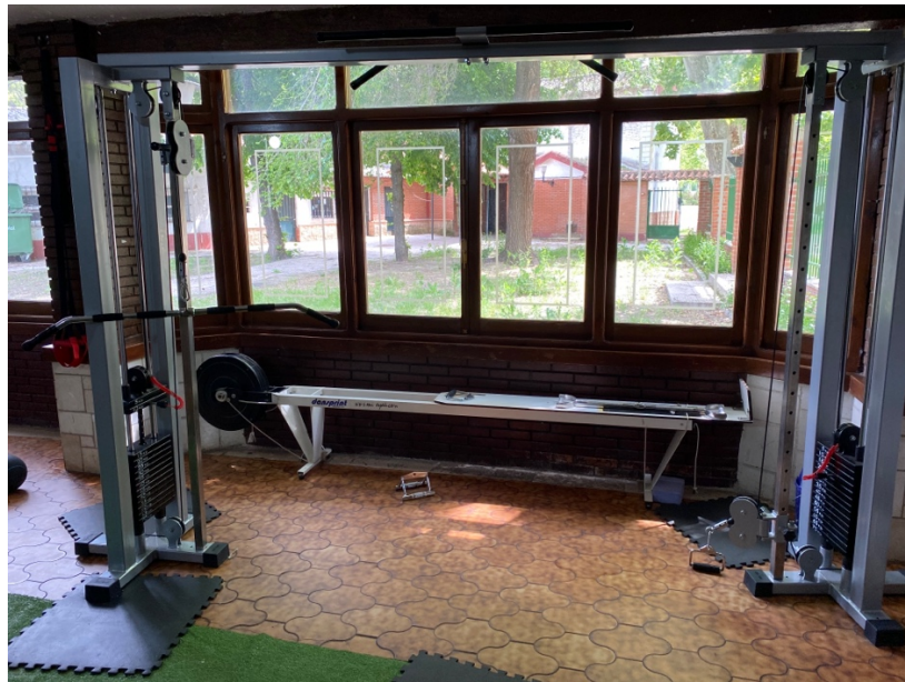
FOTOGRAFÍA 4. MULTIREHABILITACIÓN. 4 ESTACIONES - 2 TORRES.