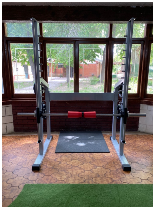
FOTOGRAFÍA 3. BANCO DE PRESS TRAS NUCA OLÍMPICO