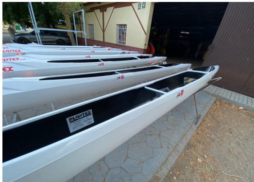
C1_FMP – CETD 12