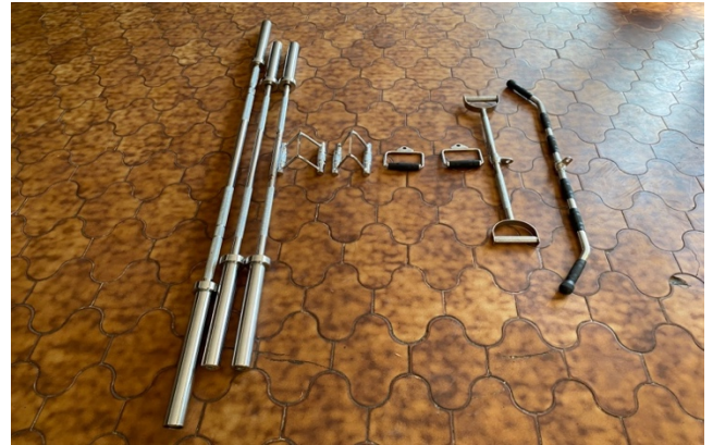
FOTOGRAFÍA 7. BARRAS Y AGARRE