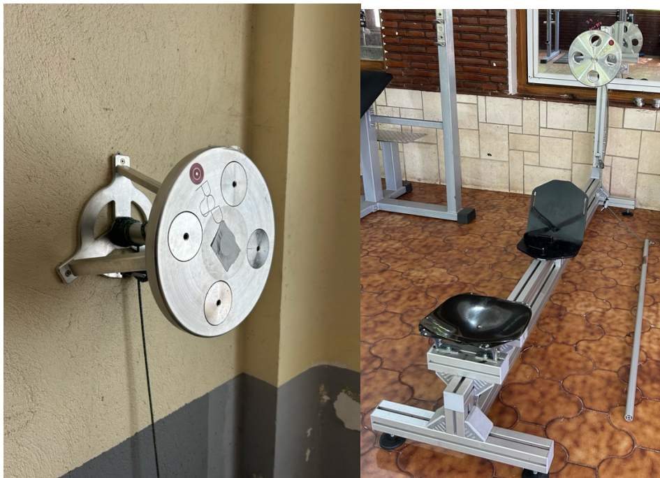
FOTOGRAFÍA 12. ERGOMETRO KAYAK ISOINERCIAL Y DOS VOLANTES DE INERCIA