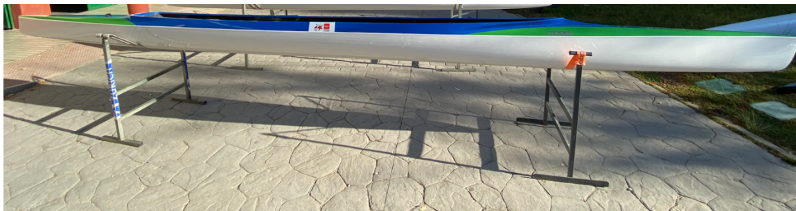
C2_FMP – CETD 02