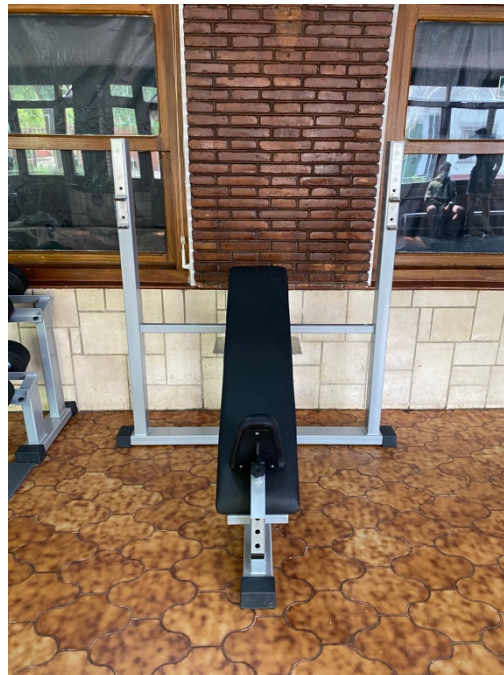
FOTOGRAFÍA 2. BANCO DE PRESS SUPERIOR OLÍMPICO.