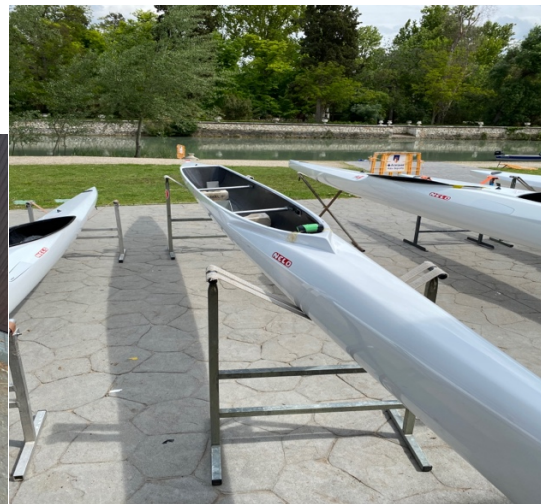
C2_FMP – CETD 01