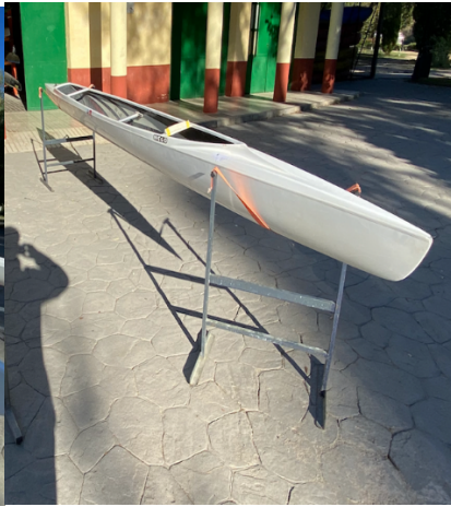
C1_FMP – CETD 05