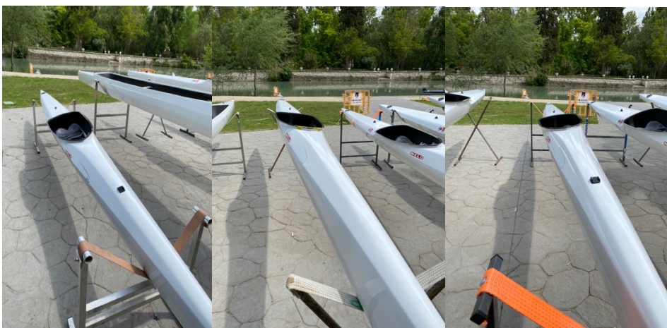
K1_FMP – CETD 06