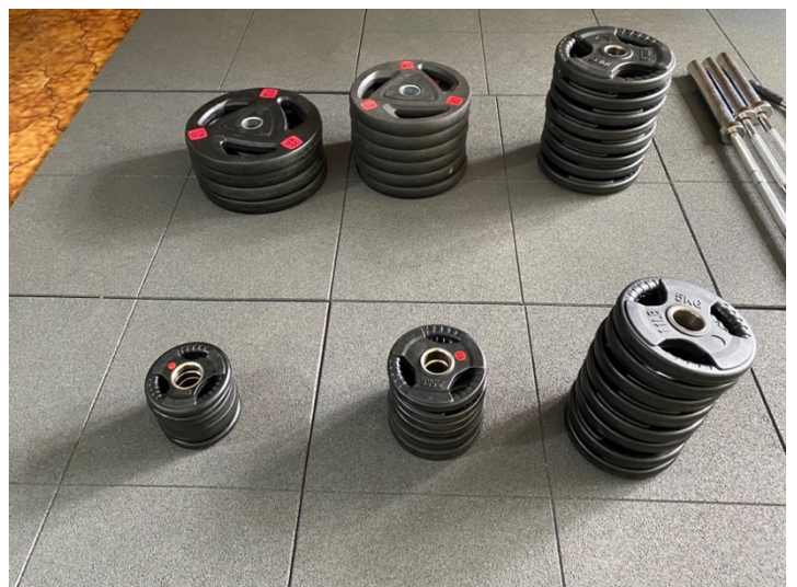
FOTOGRAFÍA 6. DISCOS