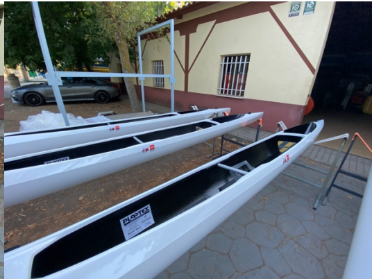
C1_FMP – CETD 07