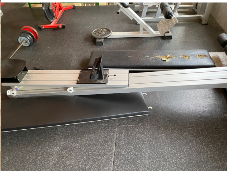
FOTOGRAFÍA 10. CARROS DANSPRINT FITNESS